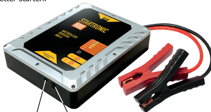
Mikro-USBPort (5V / 2A)