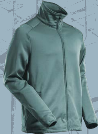
35 Helles Waldgrün