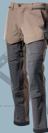
5689 Dunkel Sandbeige/Anthrazitgrau