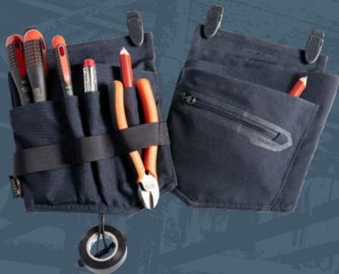
22550-012 Hängetasche für Elektriker