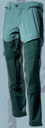
3534 Helles Waldgrün/Waldgrün